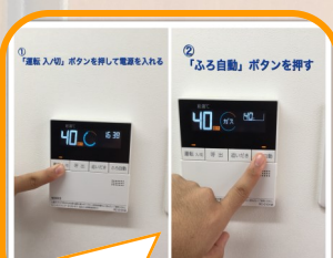
実際に生徒のiPadに入れた「お風呂の入れ方」の写真です。