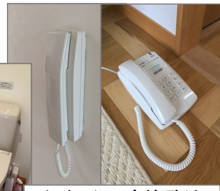
インターホン・内線電話