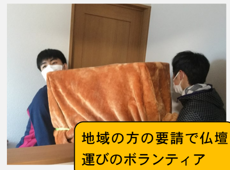
地域の方の要請で仏壇運びのボランティア