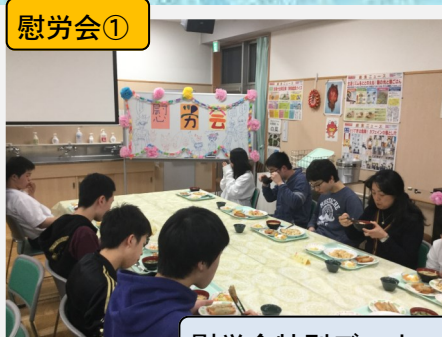
慰労会特別ディナー