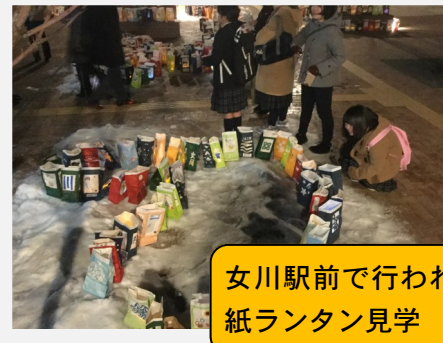
女川駅前で行われた紙ランタン見学