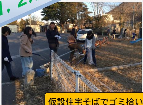
仮設住宅そばでゴミ拾い