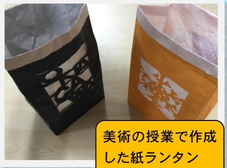
美術の授業で作成した紙ランタン