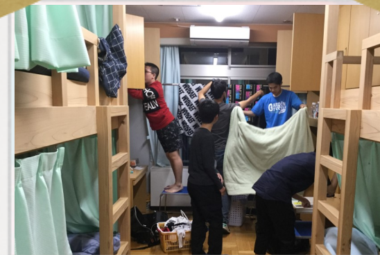
生活のスキルアップ(整頓)