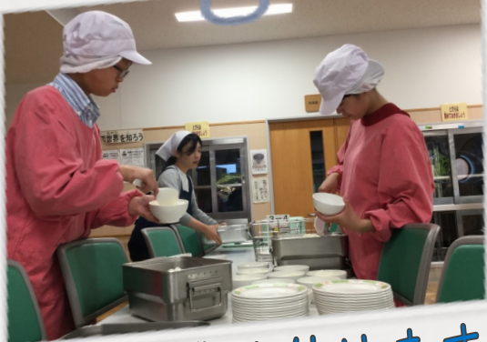
丁寧に盛り付けます