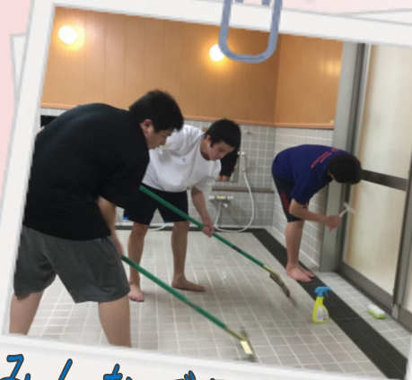
みんなで風呂掃除