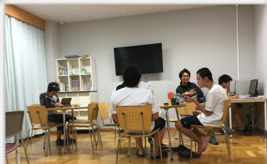
談話室が広く感じます